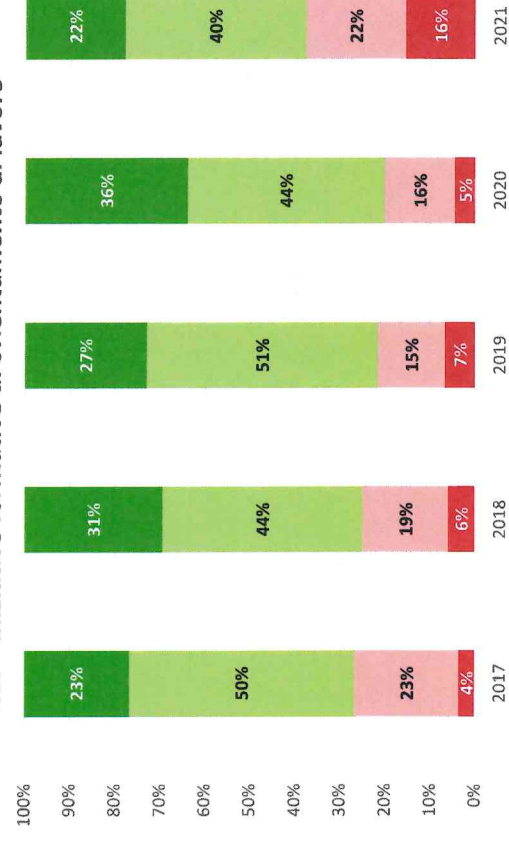
T.2.7 - Iniziative formative di orientamento al lavoro